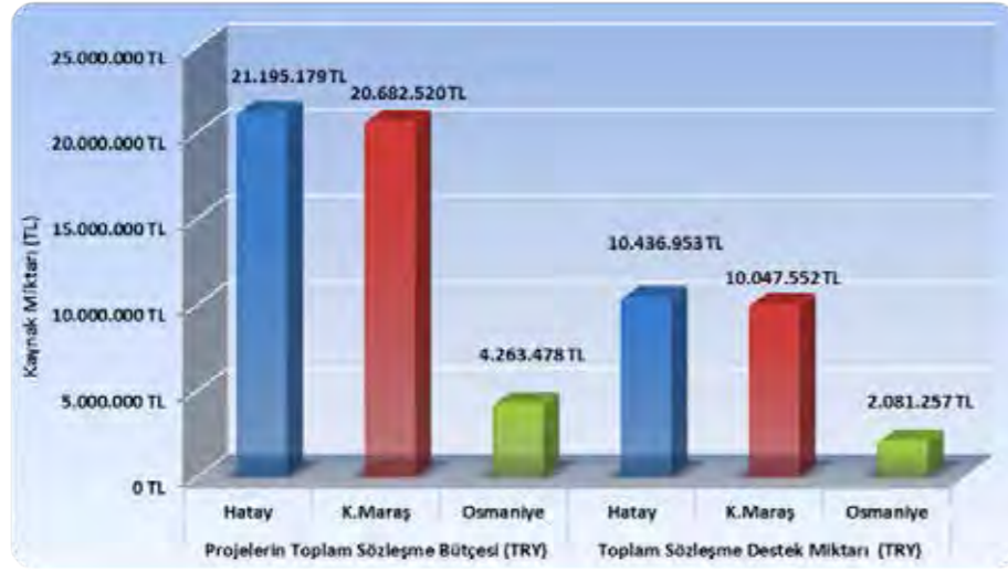
Grafik-3: 2012 Yılı Yenilikçilik Mali Destek Programı İllere Göre Bütçe Dağılımı

Not: Fesih edilen ve imzalanmayan projeler grafiğe dahil edilmemiştir.